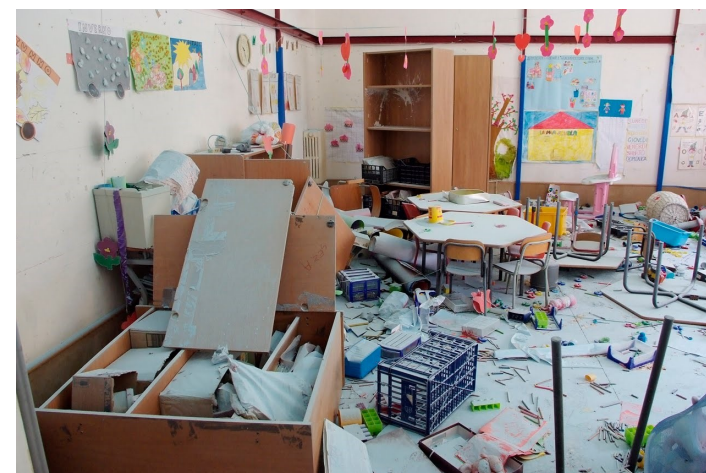
{ Vandalismo in una scuola di Milano }

Con il termine vandalismo si indica la tendenza a compiere azioni di interdizione, danneggiamento o distruzione di beni materiali o immateriali senza alcun motivo logico apparente, per cui sembra che il vandalo non ne apprezzi il valore .