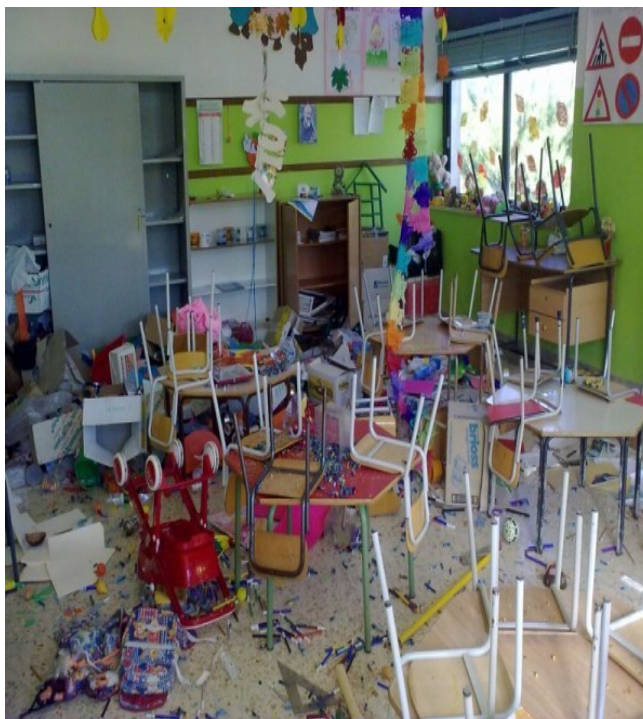
Vandalismo in una scuola di Genova